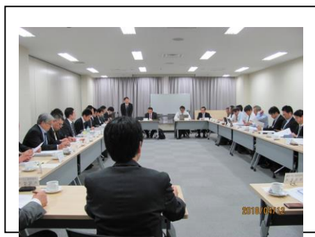
審査・運営委員会

ノミネート委員会は優れた案件を積極的に発掘する意図から設置され、15件のノミネート（発掘・応募推薦）を行った。