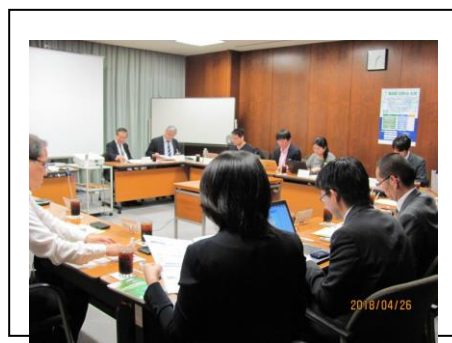
ノミネート委員会